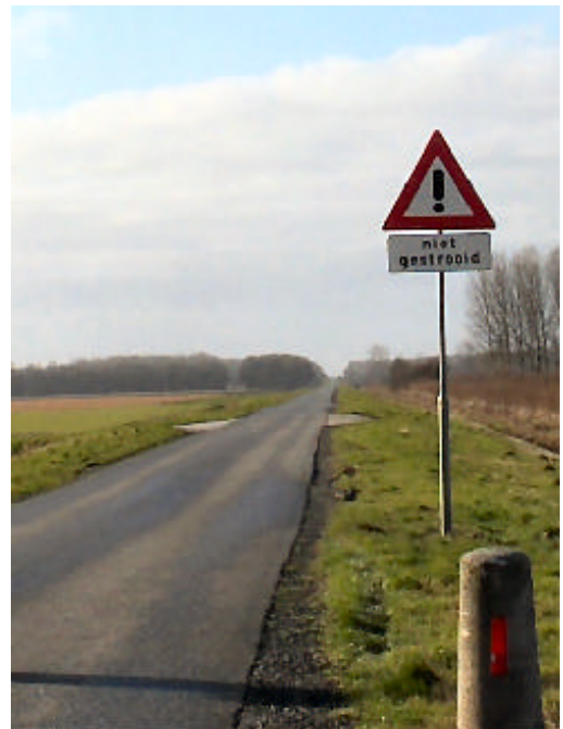
Op plaatsen waar strooiroutes eindigen in de loop van een doorgaande weg wordt dat door middel van een waarschuwingsbord aangegeven

Als de gladheid overdag aanhoudt, wordt een aanvullende actie uitgevoerd. In aanvulling op de basisactie worden dan ook de blauwe routes planmatig gestrooid. Met blauwe cirkels zijn winkelgebieden aangegeven waarvan de hoofdroutes machinaal worden gestrooid in de aanvullende actie. Daardoor wordt het netwerk van gestrooide routes verfijnd.